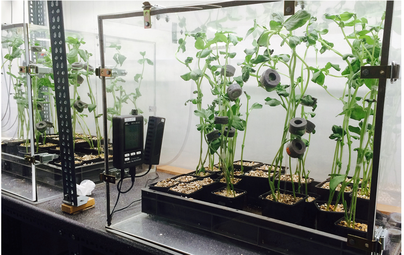
Photo des enceintes d'élevage mises en place à Gembloux Agro-Bio Tech

La conclusion des travaux est donc claire. La hausse de la concentration du CO 2 influence directement le signal d'alerte des pucerons via la diminution de trois des quatre signaux analysés. François Verheggen résume le constat en d'autres mots: "En atmosphère enrichie, le "cri d'alarme" laisse davantage indifférent qu'en atmosphère normale" . Les pucerons s'en retrouvent plus vulnérables à leurs prédateurs: tout bénéfique pour des insectes auxiliaires comme les coccinelles, qui auront plus facilement accès à leur nourriture. Et... tout bénéfique pour l'agriculteur.